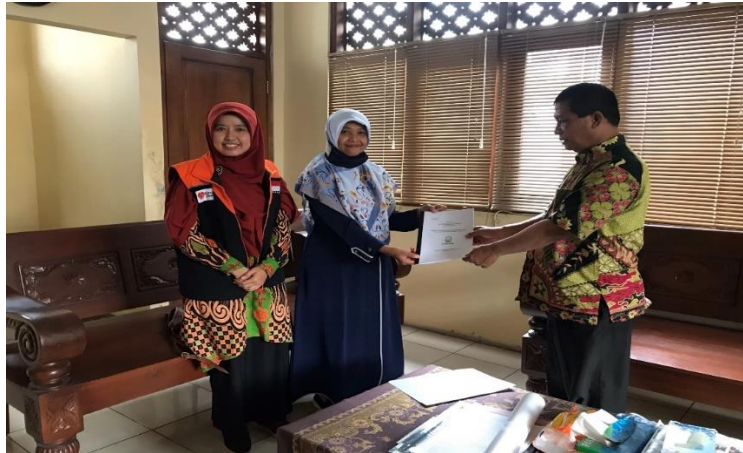
Gambar 1. Tahapan Persiapan

Pelaksanaan pelatihan dilaksanakan pada Tanggal 21 Maret 2023, mulai pukul 08.00 sampai 12.30, sesuai dengan kesepakatan waktu peserta pelatihan. Pelatihan bertempat di Balai Pertemuan (Pendopo) Kelurahan Gilingan. Kegiatan Pelatihan dihadiri oleh 30 peserta.