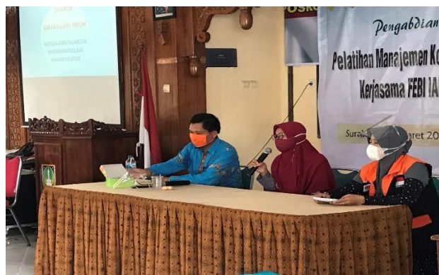
Gambar 5. Evaluasi pelaksanaan pendampingan sekaligus penutupan

Dengan pemahaman baru yang telah disampaikan, maka peserta memiliki pemahaman yang cukup untuk bisa meningkatkan kinerja koperasi syariah menjadi lebih baik dan berjalan sesuai dengan norma dan nilai-nilai syariah.