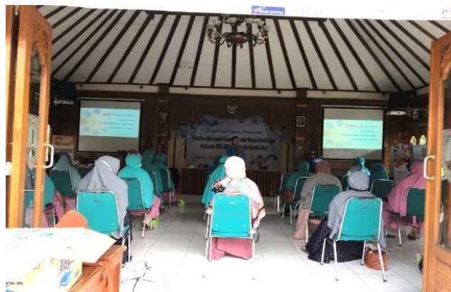
Gambar 3. Pendampingan pada materi manajemen koperasi syariah

Koperasi yang menerapkan manajemen strategi berorientasi pada keunggulan produk selalu akan selalu mengembangkan produk-produknya dengan kualitas tinggi dan satu langkah didepan dibanding pesaingnya. Produk utama pada koperasi ini adalah simpanan dan pinjaman maka produk simpanan dan pinjaman tersebut harus dapat dijadikan tolak ukur keberhasilan bagi koperasi.