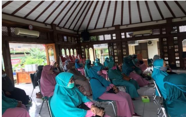
Gambar 4. Pendampingan pada materi strategi pengembangan koperasi

Dengan pemahaman baru yang telah disampaikan, maka peserta memiliki pemahaman yang cukup untuk bisa meningkatkan kinerja koperasi syariah menjadi lebih baik dan berjalan sesuai dengan norma dan nilai-nilai syariah.