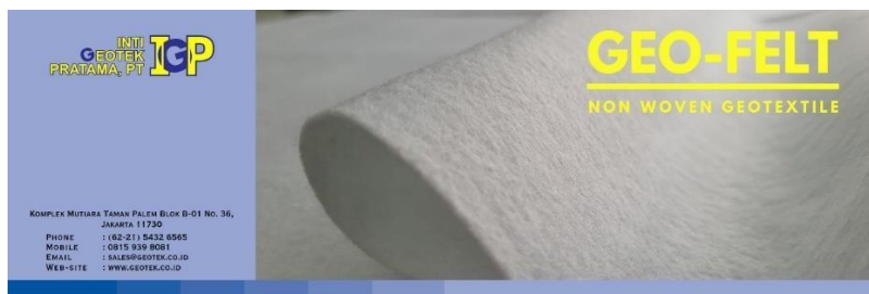
Gambar 3. Facebook Post "Geo-Felt"

Konten ini bertujuan untuk mempromosikan dan menjelaskan jenis produk Eco-Grid Geogrid yang di jual oleh PT Inti Geotek Pratama. Konten ini difokuskan pada gambar produk dan penempatan nama produk dan penempatan elemen-elemen yang sama dengan company profile PT Inti Geotek Pratama untuk menarik perhatian konsumen.