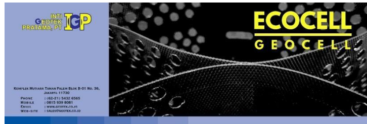
Gambar 5. Facebook Post "Eco-Cell"

Konten Facebook untuk produk Eco-Cell yang dijual oleh PT Inti Geotek Pratama, konten ini dibuat dalam ukuran (1080 x 1080 px) dengan menampilkan foto produk milik PT Inti Geotek Pratama dengan nama produk di kiri atas dan tulisan lokasi, alamat kantor, link website dan Gmail dikategorikan kedalam tiga (3) bagian, nama produk dan informasi dan lokasi tempat yang bisa di cari oleh konsumen.