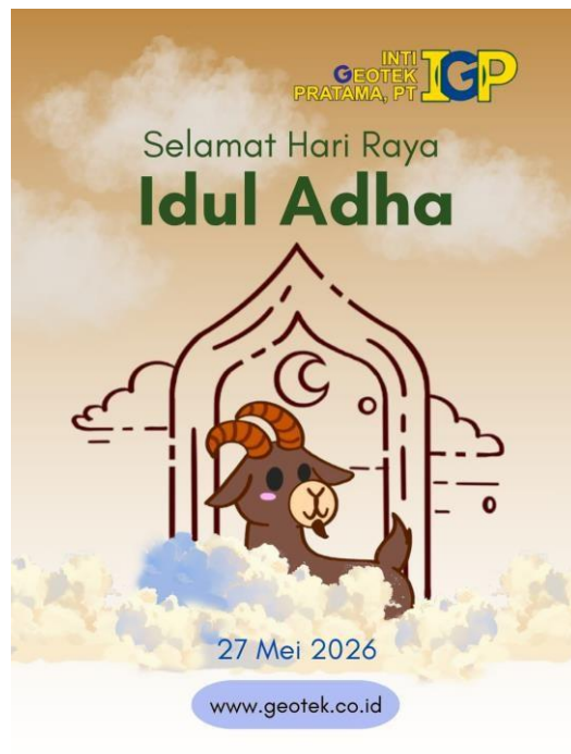
Gambar 7. Poster Perayaan Idul Adha

Sebagai bentuk upaya peningkatan media sosial dari PT Inti Geotek Pratama, diadakan posting dalam hari raya libur nasional tertentu. Salah satu libur nasional yang digunakan adalah hari raya Idul Adha 1447