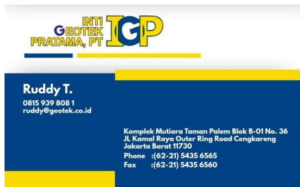
Gambar 6. Kartu Nama

Konten Facebook untuk produk Eco-Cell yang dijual oleh PT Inti Geotek Pratama, konten ini dibuat dalam ukuran (1080 x 1080 px) dengan menampilkan foto produk milik PT Inti Geotek Pratama dengan nama produk di kiri atas dan tulisan lokasi, alamat kantor, link website dan Gmail dikategorikan kedalam tiga (3) bagian, nama produk dan informasi dan lokasi tempat yang bisa di cari oleh konsumen.