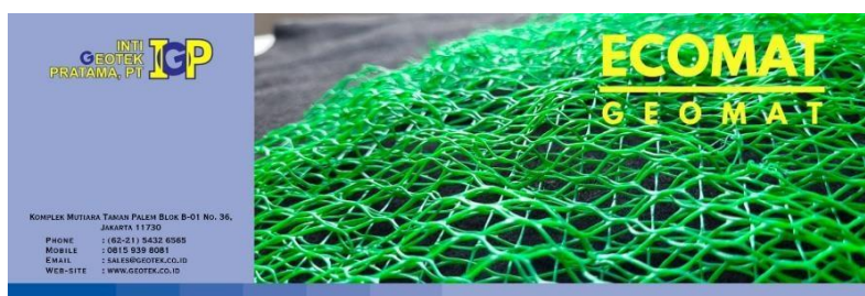
Gambar 4. Facebook Post "Geo-Felt"

Konten Facebook untuk produk Geo-Felt Non Woven Geotextile yang dijual oleh PT Inti Geotek Pratama, konten ini dibuat dalam ukuran (1080 x 1080 px) dengan menampilkan foto produk milik PT Inti Geotek Pratama dengan nama produk di kiri atas dan tulisan lokasi, alamat kantor, link website dan Gmail dikategorikan kedalam tiga (3) bagian, nama produk dan informasi dan lokasi tempat yang bisa di cari oleh konsumen.