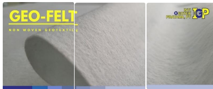
Gambar 1. Instagram Carousel "Pro-Felt"

Praktikan membuat sebanyak 10 desain untuk postingan Facebook post , 9 set gambar untuk postingan Instagram Carousel , 11 desain untuk postingan Instagram Story , kartu nama, booklet untuk company profile , serta 9 set desain untuk booklet Geotek Indopro. Berikut adalah beberapa contoh dari hasil kerja praktikan: