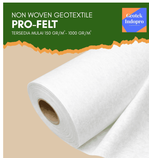
Gambar 8. Poster Pro-Felt Geotek Indopro

H. Digunakan background berwarna coklat terang serta dekorasi bertema Islam, dan menggunakan karikatur kambing berwarna coklat gelap untuk menonjolkan kurban kambing yang sering digunakan di perayaan Idul Adha.