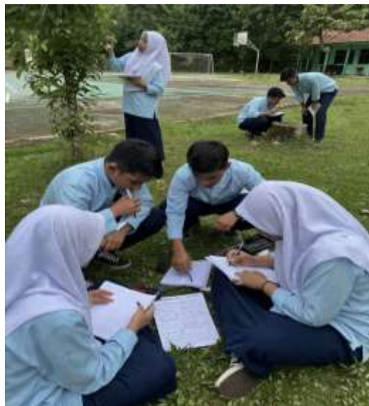
Gambar 4. Kegiatan Observasi Lapangan oleh Peserta Pengabdian dalam Penyusunan Teks Laporan Hasil Observasi

Dokumentasi tersebut memperlihatkan kegiatan observasi yang dilakukan oleh siswa sebagai peserta pengabdian di lingkungan sekolah. Siswa terlihat melakukan pengamatan langsung terhadap objek berupa tanaman yang berada di sekitar area sekolah, kemudian mencatat hasil temuannya ke dalam buku catatan. Aktivitas ini dilakukan secara berkelompok. Setiap siswa memiliki peran, baik sebagai pengamat maupun pencatat data. Kondisi lingkungan yang autentik, seperti keberadaan taman sekolah dan fasilitas pendukung, turut menunjang keterlibatan siswa dalam proses pelatihan. Kegiatan ini mencerminkan penerapan pendekatan kontekstual dalam pembelajaran, khususnya dalam melatih keterampilan menulis teks laporan hasil observasi, berpikir kritis, serta kemampuan mengolah informasi berdasarkan pengalaman empiris di lapangan. Setelah kegiatan observasi selesai, siswa diminta untuk menyusun draf teks laporan hasil observasi berdasarkan data yang telah diperoleh. Dalam kegiatan ini, siswa dilatih untuk mengorganisasi informasi secara sistematis serta menggunakan bahasa yang sesuai dengan kaidah kebahasaan. Berikut juga disajikan dokumentasi peserta menulis teks laporan hasil observasi.