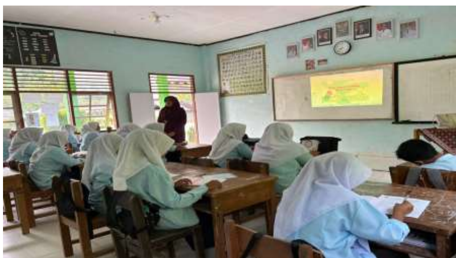
Gambar 5. Peserta Menulis Teks Laporan Hasil Observasi dengan Didampingi Tim Pengabdian

Pada gambar tersebut, peserta pengabdian sedang melakukan kegiatan observasi lapangan di lingkungan sekolah sebagai bagian dari pelatihan. Mereka terlihat bekerja secara berkelompok dengan membagi peran. Sebagian siswa mengamati objek secara langsung, seperti tanaman dan kondisi sekitar, sementara yang lain mencatat hasil pengamatan ke dalam lembar kerja atau buku tulis. Selain itu, tampak pula peserta yang mendiskusikan temuan mereka bersama kelompoknya untuk menyusun laporan hasil observasi secara sistematis. Aktivitas ini menunjukkan keterlibatan aktif peserta dalam proses pembelajaran berbasis praktik, yang bertujuan untuk melatih kemampuan mengamati, mencatat data, berdiskusi, serta menyusun teks laporan hasil observasi berdasarkan pengalaman langsung di lapangan. Berikut disajikan dokumentasi peserta pengabdian menyusun teks laporan hasil observasi setelah melakukan pengumpulan data di lapangan.