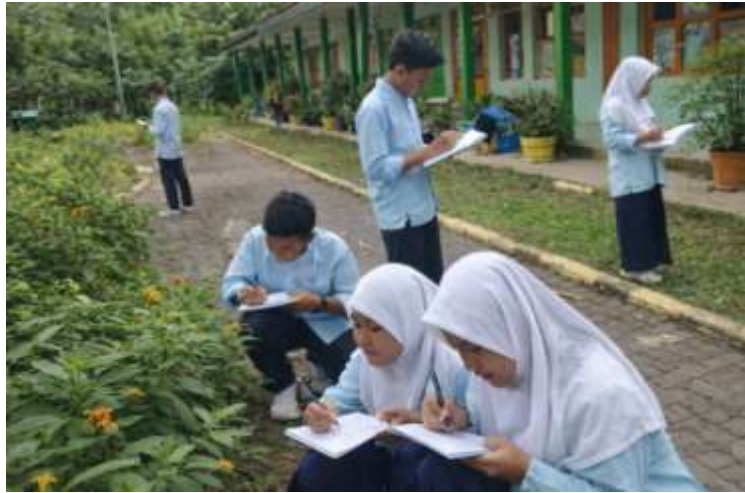
Gambar 3. Peserta Melakukan Kegiatan Observasi di Luar Kelas

Dokumentasi tersebut memperlihatkan kegiatan observasi yang dilakukan oleh siswa sebagai peserta pengabdian di lingkungan sekolah. Siswa terlihat melakukan pengamatan langsung terhadap objek berupa tanaman yang berada di sekitar area sekolah, kemudian mencatat hasil temuannya ke dalam buku catatan. Aktivitas ini dilakukan secara berkelompok. Setiap siswa memiliki peran, baik sebagai pengamat maupun pencatat data. Kondisi lingkungan yang autentik, seperti keberadaan taman sekolah dan fasilitas pendukung, turut menunjang keterlibatan siswa dalam proses pelatihan. Kegiatan ini mencerminkan penerapan pendekatan kontekstual dalam pembelajaran, khususnya dalam melatih keterampilan menulis teks laporan hasil observasi, berpikir kritis, serta kemampuan mengolah informasi berdasarkan pengalaman empiris di lapangan. Setelah kegiatan observasi selesai, siswa diminta untuk menyusun draf teks laporan hasil observasi berdasarkan data yang telah diperoleh. Dalam kegiatan ini, siswa dilatih untuk mengorganisasi informasi secara sistematis serta menggunakan bahasa yang sesuai dengan kaidah kebahasaan. Berikut juga disajikan dokumentasi peserta menulis teks laporan hasil observasi.