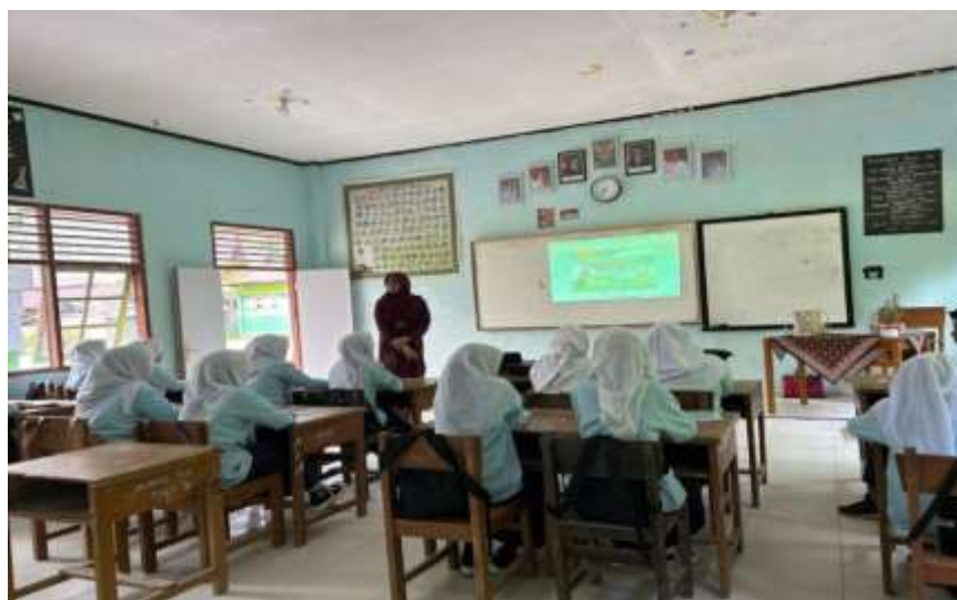
Gambar 1. Tim Pengabdian Mengenalkan Konsep kepada Peserta

Pada tahap pengenalan konsep dasar, siswa diberikan penjelasan mengenai pengertian teks laporan hasil observasi, tujuan penulisan teks, serta struktur teks yang meliputi pernyataan umum, deskripsi bagian, dan deskripsi manfaat. Selain itu, siswa juga diperkenalkan dengan ciri kebahasaan teks laporan hasil observasi seperti penggunaan kalimat definisi, istilah teknis, serta penggunaan bahasa baku. Penjelasan ini bertujuan untuk memberikan landasan konseptual kepada siswa sebelum mereka melakukan kegiatan observasi dan penulisan laporan. Berikut disajikan dokumentasi kegiatan pengenalan konsep.