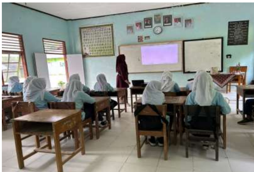
Gambar 2. Pemutaran Video Pembelajaran

Kegiatan berikutnya adalah pemutaran video pembelajaran yang menampilkan contoh proses observasi di lingkungan sekitar serta tahapan penyusunan laporan hasil observasi. Penggunaan media audiovisual bertujuan untuk memberikan gambaran yang lebih konkret kepada siswa mengenai proses observasi serta cara mencatat data hasil pengamatan. Setelah pemutaran video, kegiatan dilanjutkan dengan diskusi reflektif untuk membahas isi video serta menghubungkannya dengan konsep yang telah dipelajari sebelumnya. Berikut disajikan dokumentasi kegiatan pemutaran video pembelajaran.