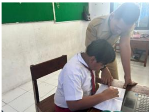
Gambar 3. Interaksi siswa dan guru

Hasil penelitian juga menunjukkan bahwa interaksi antara guru dan siswa berlangsung secara aktif melalui kegiatan tanya jawab, diskusi, dan pemberian bimbingan secara langsung selama siswa menulis cerita narasi. Guru mendampingi siswa yang mengalami kesulitan-kesulitan dalam menentukan ide, menyusun alur cerita, maupun mengembangkan isi tulisan. Temuan ini menunjukkan bahwa keberhasilan pembelajaran menulis narasi tidak hanya ditentukan oleh materi yang diberikan, tetapi juga oleh intensitas pendampingan guru selama proses menulis berlangsung. Bimbingan yang diberikan secara langsung memungkinkan siswa memperoleh bantuan ketika mengalami kesulitan sehingga hambatan belajar dapat segera diatasi. Temuan ini sejalan dengan adanya pendapat (Hidayat, et al., 2025) yang menyatakan bahwa anak dapat mencapai potensi maksimalnya melalui dukungan atau scaffolding dari guru maupun pendamping belajar.