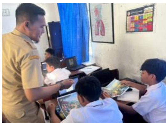
Gambar 2. Media ajar

Hasil penelitian juga menunjukkan bahwa interaksi antara guru dan siswa berlangsung secara aktif melalui kegiatan tanya jawab, diskusi, dan pemberian bimbingan secara langsung selama siswa menulis cerita narasi. Guru mendampingi siswa yang mengalami kesulitan-kesulitan dalam menentukan ide, menyusun alur cerita, maupun mengembangkan isi tulisan. Temuan ini menunjukkan bahwa keberhasilan pembelajaran menulis narasi tidak hanya ditentukan oleh materi yang diberikan, tetapi juga oleh intensitas pendampingan guru selama proses menulis berlangsung. Bimbingan yang diberikan secara langsung memungkinkan siswa memperoleh bantuan ketika mengalami kesulitan sehingga hambatan belajar dapat segera diatasi. Temuan ini sejalan dengan adanya pendapat (Hidayat, et al., 2025) yang menyatakan bahwa anak dapat mencapai potensi maksimalnya melalui dukungan atau scaffolding dari guru maupun pendamping belajar.