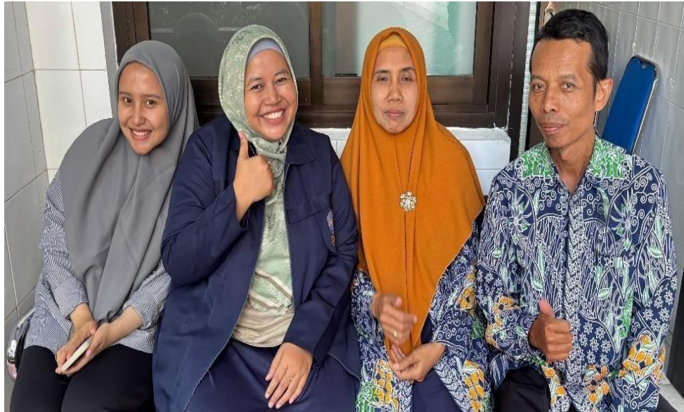
Gambar 2. Sosialisasi Awal dengan Mitra

Melalui wawancara dengan mitra, diketahui bahwa belum ada matapelajaran atau literasi terkait keuangan digital. Akan tetapi siswa sudah diajarkan literasi keuangan dasar pada matapelajaran ekonomi. Dari segi sosial ekonomi, siswa MA Muhammadiyah 1 Kota Malang memiliki latar belakang yang beragam. Meskipun demikian, kerentanan terhadap isu literasi keuangan tidak memandang status ekonomi. Justru, kurangnya pemahaman tentang manajemen keuangan dasar membuat mereka semua berisiko.