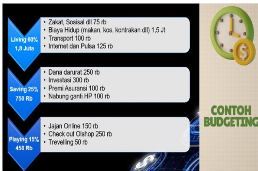
Gambar 6. Materi Contoh Budgeting

Pada aspek keterampilan, kegiatan ini memberikan dampak positif berupa peningkatan kemampuan peserta dalam mengelola keuangan pribadi secara sederhana dan berbasis digital. Peserta dilatih untuk menyusun anggaran keuangan sederhana, membedakan antara kebutuhan dan keinginan, serta memanfaatkan aplikasi keuangan digital yang aman dan legal sebagai alat pencatatan dan pengendalian keuangan. Keterampilan ini menjadi bekal penting bagi peserta dalam membangun kebiasaan finansial yang sehat sejak dini. Hasil ini sejalan dengan penelitian Suryanto dan Rasmini (2020) yang menyatakan bahwa literasi keuangan berpengaruh signifikan terhadap perilaku pengelolaan keuangan generasi muda (Suryanto & Rasmini, 2020).