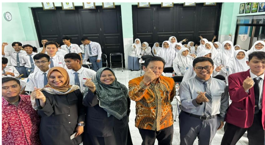
Gambar 5. Sosialisasi Pengabdian

Selain peningkatan pengetahuan, kegiatan pengabdian ini juga menghasilkan perubahan sikap peserta terhadap penggunaan teknologi keuangan digital. Peserta menunjukkan sikap yang lebih kritis dan berhati-hati terhadap tawaran keuntungan instan yang sering dijanjikan oleh platform judi online maupun pinjaman online ilegal. Berdasarkan hasil diskusi dan evaluasi pasca-kegiatan, mayoritas peserta menyatakan kesadaran untuk lebih selektif dalam menggunakan aplikasi keuangan digital serta memiliki komitmen untuk menghindari judi dan pinjol (Kumanireng & Utomo, 2023). Perubahan sikap ini mendukung temuan (2)