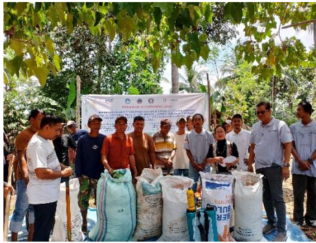
Gambar 4. Persiapan Bahan-bahan