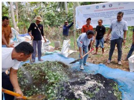
Gambar 5. Penyusunan Bahan berlapis