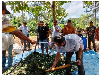
Gambar 6. Pencampuran Bahan