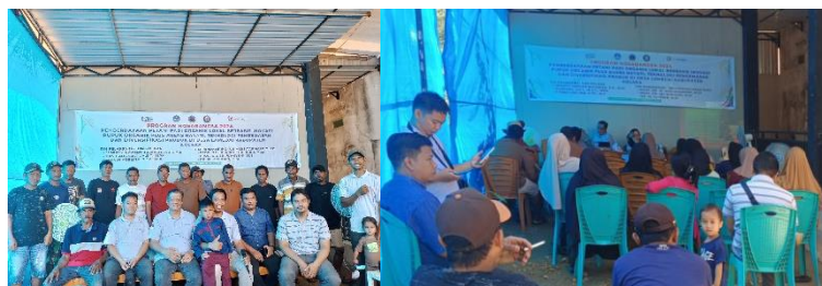
Gambar 3. Sosialisasi Program dan Pelatihan

Kegiatan pelatihan diawali dengan sosialisasi dan pengenalan program kosabangsa selanjutnya sosialisasi manfaat pupuk organik. Pada kegiatan pembuatan pupuk organik dijelaskan bahwa tidak hanya mendemonstrasikan cara pembuatan pupuk namun diuraikan juga secara detail terkait peralatan-peralatan yang digunakan beserta fungsinya serta bahan-bahan yang digunakan dijelaskan terkait komposisi dan fungsi masing-masing bahan yang digunakan. Adapun Bahan yang digunakan merupakan bahan yang mudah dijumpai dan bahkan masing-masing petani memiliki sumberdaya yang tersedia disekitar tempat tinggal. Para petani juga memperoleh penjelasan terkait SOP pembuatan pupuk organik dan mampu menjalan SOP tersebut secara tertib.