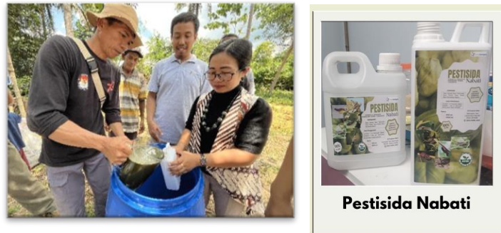
Gambar 8. Proses Pembuatan Pestisida hingga Jadi Produk