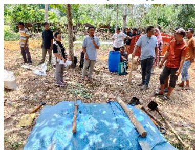
Gambar 7. Proses Fermentasi