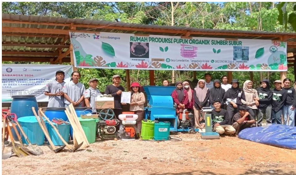
Gambar 2. Alat dan Teknologi Rumah Produksi Pupuk Organik

Pada kegiatan pelatihan pembuatan pupuk organik masih menggunakan bahan dan alat skala kecil dengan target Masyarakat mampu memahami secara mendalam dan mampu memproduksi pupuk organik secara mandiri dalam skala besar kedepannya. Peralatan yang disiapkan meliputi Cangkul, sekop, parang, mesin mencacah hijauan, karung, ember, tangka semprot/sprayer, terpal, thermometer, karung kemasan, timbangan, mesin menjahit karung. Pada kegiatan kosabangsa tim pelaksana telah memfasilitasi peralatan tersebut yang disajikan dalam gambar berikut.