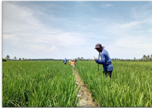
Gambar 1. Kondisi Padi Organik Desa Lamedai

( nutritional attributes ) dan ramah lingkungan ( eco-labelling attributes ) (Oktarian, Yanti. 2022; Virga dkk., 2020; Yusriadi dkk., 2022).